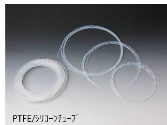
PTFE/シリコンチューブ