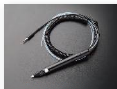
カルコードタイプ:PCSW-02